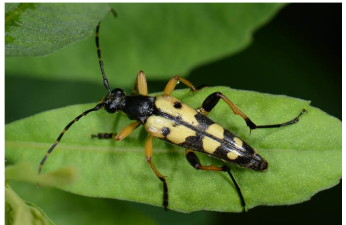
Geringelde smalboktor / E. van Asseldonk

Stichting Koekeloere, opgericht in juli 2007, heeft als doel de kennis over en het voorkomen van flora en fauna te vergroten. Stichting Koekeloere heeft als primair aandachtsgebied: Nationaal Park De Meinweg .