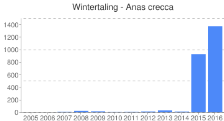
Figuur 2: Aantalsontwikkeling van de Wintertaling op de Meinweg. Foto paartje Wintertaling Peter Heuts