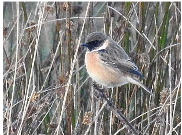
Roodborsttapuit / E. van Asseldonk

Roodborsttapuit Tijdens de inventarisatie in 2015 werden er 60 territoria vastgesteld, figuur 2. In 2012 werden er nog 73 territoria vastgesteld, een afname waarvan veronderstelt kan worden dat hij veroorzaakt wordt door een waarnemereffect (nieuwe karteerders), maar ook in gebieden met ervaren Meinwegkarteerders werden minder territoria vastgesteld. Is de soort op een terugweg? Desondanks wordt de Natura2000 eis van 20 territoria met gemak gehaald.